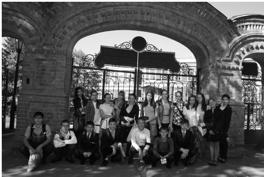
На фото: 7Е класс около музея литературы искусства и культуры Алтайского края