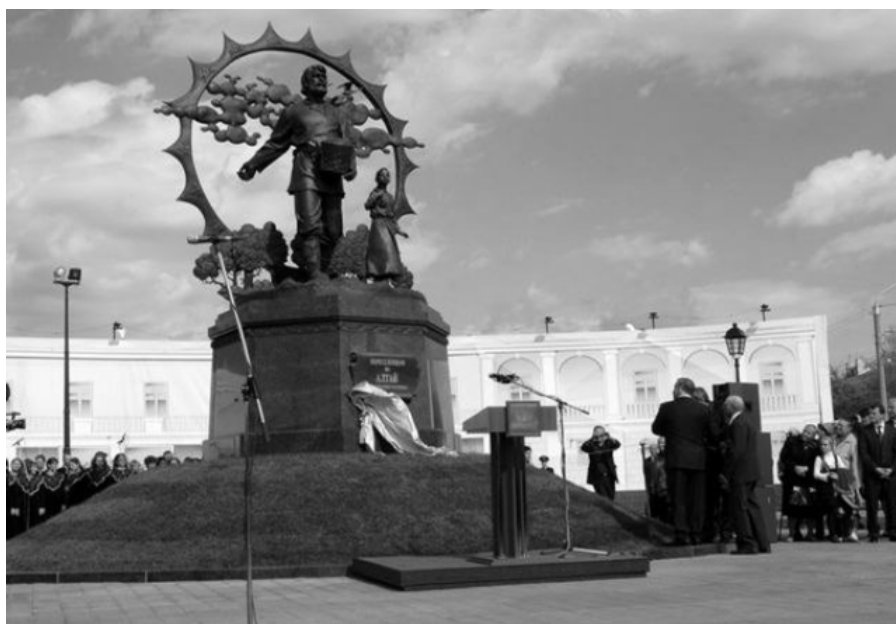
На фото скульптурная композиция «Сеятель», открытая к 75-летию Алтайского края.