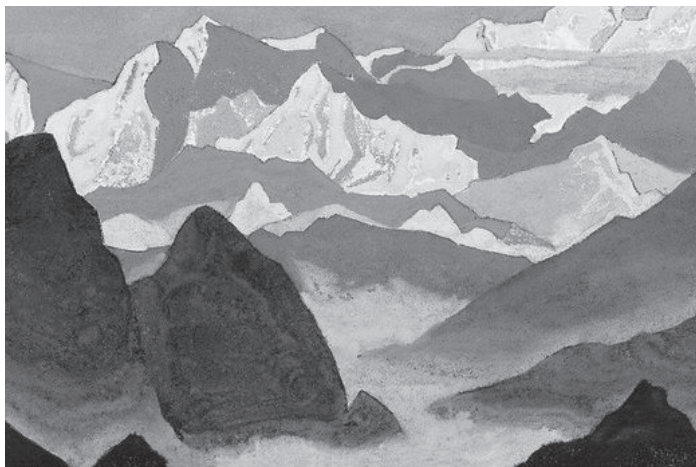
«Канченджанга. Гималаи» Николай Рерих

В музее нас, учеников 6Д класса, познакомили с биографией великого художника. Рассказали о сложной длительной Центрально-Азиатской экспедиции, которую предприняли Рерихи в беспокойные двадцатые годы прошлого века. Под угрозой бандитских налетов, преодолевая преграды, поставленные природой и людьми, прошли они от Индии в Россию до Москвы, а затем в Горный Алтай до села Верх-Уймон, затем в Монголию и через Гималаи в Тибет, и снова в Индию.